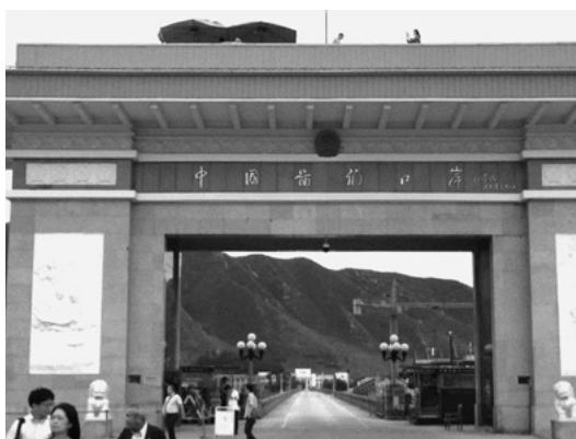
中国図們国境、中国側から北朝鮮を臨む。前方に見える山は北朝鮮。

「一帯一路」構想を基に地理的条件を利用して周辺国日韓のそれぞれの優位性を取り込みながら、念願の図們江地域開発実現を狙っているのが中国延辺州である。3年前と比べ、中国と北朝鮮の図們国境はかつて関東軍が建設した橋の隣にコンクリート製の片側一車線ながら大型トラックが通行可能と思われる橋を建設中である。中朝物流の中心は遼寧省丹東であるが、情勢変化に応じて中国は図們側にも中朝輸送インフラを整備し、補完的役割を持たせるものであると思われる。