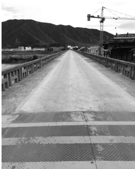
図們国境、橋の中央にある3本の帯の真ん中が国境線、奥の帯は北朝鮮。

アジアからヨーロッパへの最短航路であり今世紀の画期的な経済手段になりうるとして北東アジア（中国、日本、韓国）