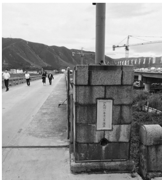
関東軍建設の橋の中間が中朝国境。右側に新たに建設中の橋とタワークレーンが見える。2018年8月30日

ロシア沿海地方商工会議所は、ヴェセーロフ副会頭が「ウラジオストク自由港」を活用して、国家戦略である北極海航路の推進とアジアエネルギー圏構想を提案した。