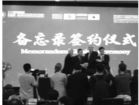
4 地域経済交流会議の合意書調印式